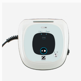
Unidad de control