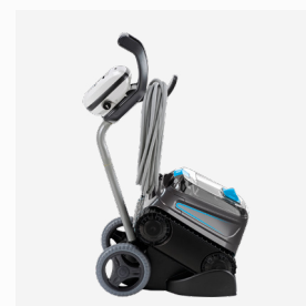
Carro de transporte